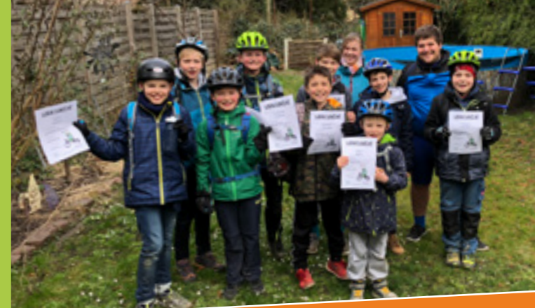
Vorbereitung auf das Radsportabzeichen

Für teilnehmende Kinder ab 10 bis 16 Jahren.